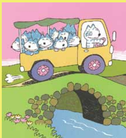
《11匹きのねことぶた》こぐま社 1976年刊印刷原稿(特色刷り校正用リトグラフ/部分)